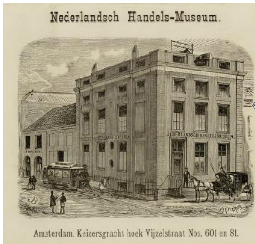
Nederlands Handels- Museum, Keizersgracht, hoek Vijzelstraat.