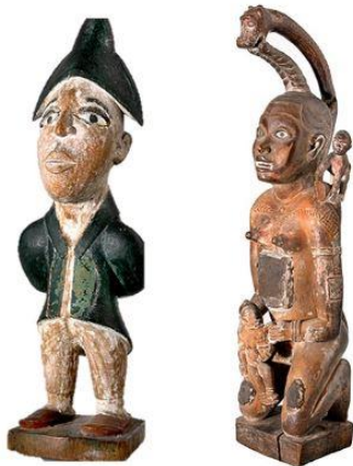
Krachtbeelden, Collectie Museum Volkenkunde Leiden, inv.nr. 1354-6 (links) en 1354-7 (rechts).

was ons vergund een blik te slaan in de zeer belangrijke verzameling en wij durven verzeekeren dat de wetenschap daarmede een groote aanwinst heeft.' Ook hier een verwijzing naar de vastberadenheid van Goddefroy: 'Het is duidelijk dat een verzamelaar met ongeloofelijke moeilijkheden heeft te kampen, om in een vreemd land, onder een bevolking die bijna op den laagsten trap der beschaving - indien dat woord gebezigd mag worden- staat, [...] en slechts door vrees in te boezemen in bedwang is te houden, om daar - bijv. fetischen te bemachtigen.' 7